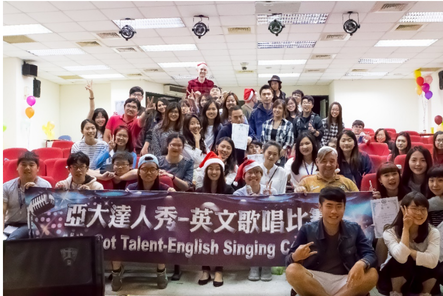
圖說：所有參賽同學、評審及觀眾等，在亞大達人秀英文歌唱比賽結束後合影。